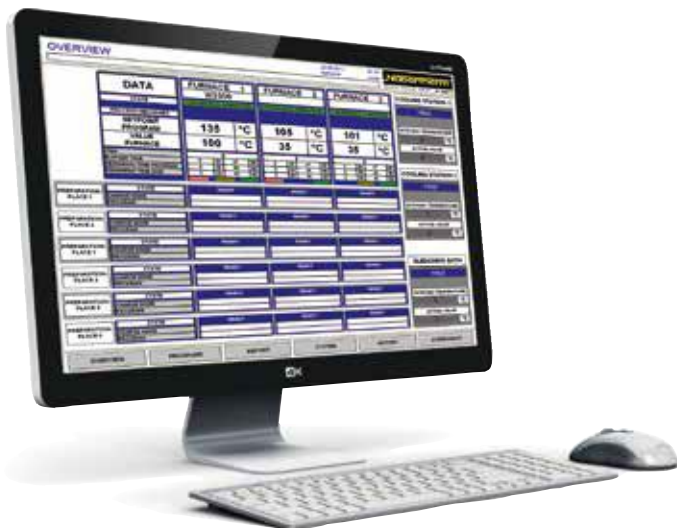
VCD-Software zur Steuerung, Visualisierung und Dokumentation

Die Bedienung ist in sieben Sprachen (DE/EN/FR/SP/IT/CH/RU) vorbereitet. Zusätzlich können ausgewählte Texte in weiteren Sprachen angepasst werden.